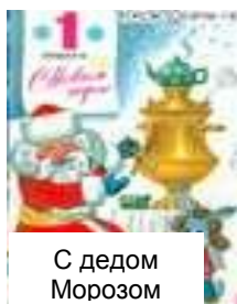
С дедом Морозом